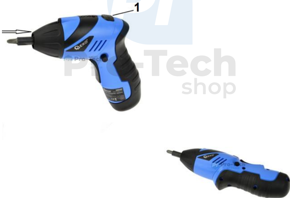
1. Tlačidlo pre vyrovnanie skrutkovača

Ak pracujete v problémových miestach, alebo chcete vrtať, stlačte tlačidlo a vyrovnajte rúčku v smere hodinových ručičiek. Teraz môžete používať skrutkovač ako vyrovnaný.